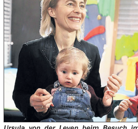
Ulrsula von der Leyen beim Besuch im Kindergarten der Fraport-AG

schen den Melde-, Jugend- und Gesundheitsämtern. Jugendämter stärken: Jugendämter und Familiengerichte sollen schneller eingreifen können bei einer Gefährdung des Kindeswohls. Bessere Zusammenarbeit von gerichten und Ämtern: Staatliche Maßnahmen bei Eltern von sogenannten Risikofamilien sollen besser abgestimmt werden. Und die Zusammenarbeit von Familiengerichten und Jugendämtern verstärkt werden.